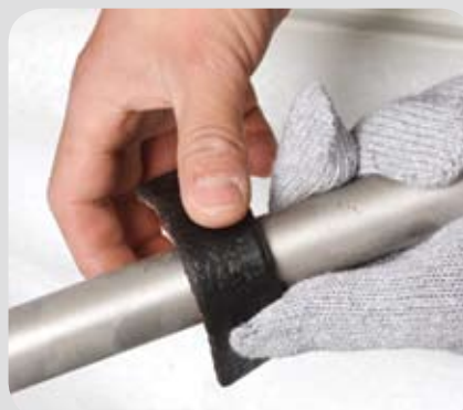
Resistencia a bajas temperaturas.

AL-KOAT ofrece la supervisión técnica, asesoría y capacitación que garanticen la correcta aplicación de sus productos.