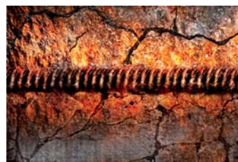
Construcción peligrosa, gravemente afectada

Una excelente resistencia a la tensión y sus propiedades de elongación, permiten la contracción y la dilatación en condiciones aún de congelamiento sin agrietarse.