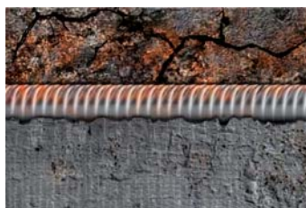
Construcción con problema de humedad